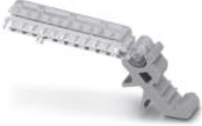
Şekil AK-DST-UK klemens etiketi ve ESL 24 x 4 iç etiket tiplerini göstermektedir

Etiket, üst etiketleme oluğu 45° olan (ör: UK klemensleri) klemenslerin grup etiketlemesi için, etiket oluğuna takılır, etiket taşıyıcı 120° açı ile eğilebilir ve EST 24 x 4 veya ESL 24 x 4 ile etiketlenebilir.